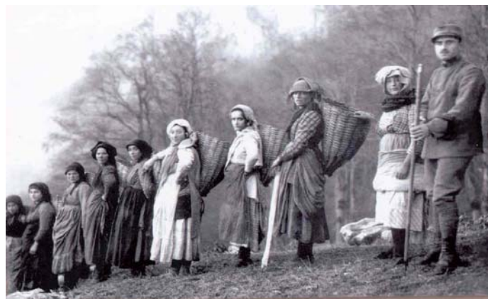
Donne che trasportano viveri ai soldati in trincea