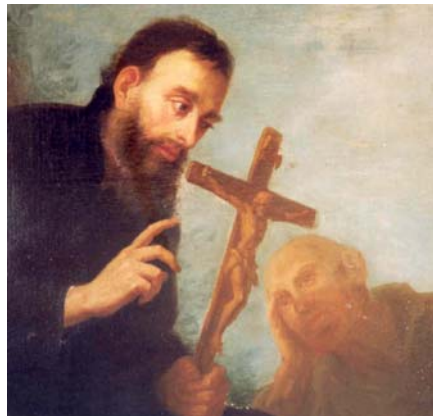
p. Filippo Cesati nel XVIII Secolo

Nell'anno 1722 il barnabita Sigismondo Calchi, precursore dell'evangelizzazione del Paese dalle Mille Pagode, toccava per primo il suolo della Birmania, oggi Myanmar. A 285 anni di distanza quell'epopea ritrova impressionante attualità nelle parole di don Cornelio Fabro († 1995), certo «che il tempo è galantuomo, che nell'inarrestabile opera di erosione della storia sopravvivono solo le conquiste essenziali, emergono solo i picchi e le vette dei monti eccelsi» .