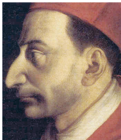
Giovanni Ambrogio Figino - San Carlo Borromeo (particolare)

Ma quando medito tra me e me che il Figlio di Dio si è completamente donato in cibo a noi, mi pare che non ci più spazio per questa distinzione: questo mistero è totalmente da bruciare nel fuoco dell'amore. Quale motivo, se non l'amore soltanto, poté spingere il Dio Buonissimo e Grandissimo a