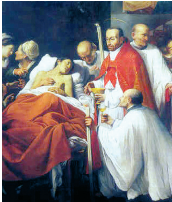
Carlo Saraceni - S. Carlo comunica un appestato

quelle ore del mattino che dovrebbero consacrare alla preghiera al trucco del loro volto e alla arriccatura dei capelli; che chiedono ogni giorno nuovi vestiti, così da rendere dei poveri infelici i loro mariti e mendichi i loro figli e da consumare i loro patrimoni.