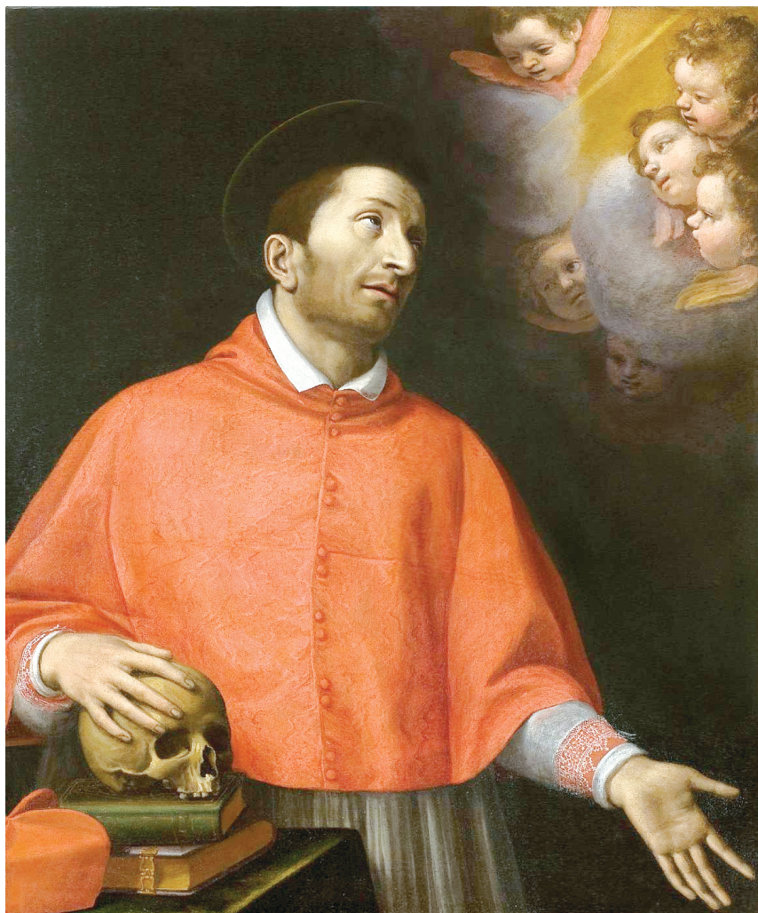
Agostino Ciampelli - S. Carlo Borromeo in preghiera

Per tale motivo ha fissato questo giorno per la celebrazione: in esso, per l'immenso dono ricevuto, vorrebbe rendere in modo tutto particolare a Cristo quel meraviglioso ringraziamento che a causa della nostra povertà noi non siamo capaci di offrire. Perciò il Figlio di Dio, che conosce tutto dalla eternità, si è fatto incontro alla nostra debolezza con l'istituzione di questo Santissimo Sacramento: per noi « Egli rese grazie » a Dio, « benedisse e spezzò » (Mt 26,26; Lc 24,30). Con questa istituzione ci ha insegnato a ringraziarlo quanto più possiamo per un dono così grande. Ma perché la Santa Madre Chiesa ha fissato proprio questo tempo per fare memoria di tale mistero? Perché proprio dopo la celebrazione degli altri misteri di Cristo: dopo i giorni del Natale, della Resurrezione, della Ascensione al Cielo e l'invio dello Spirito Santo? Figlio, non temere: tutto ciò non è senza motivo!