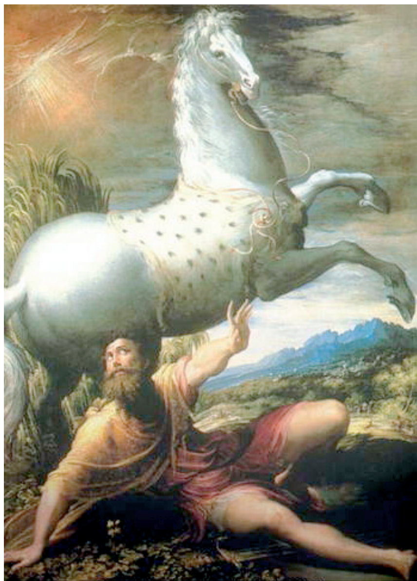
Parmigianino - Conversione di s. Paolo (1527 ca.)

Carla Busato Barbaglio-Alfio Filippi (a cura di), L'attualità del pensare di Paolo , Edb, Centro Editoriale Dehoniano, Bologna 2010, 174 pp., € 13,80.