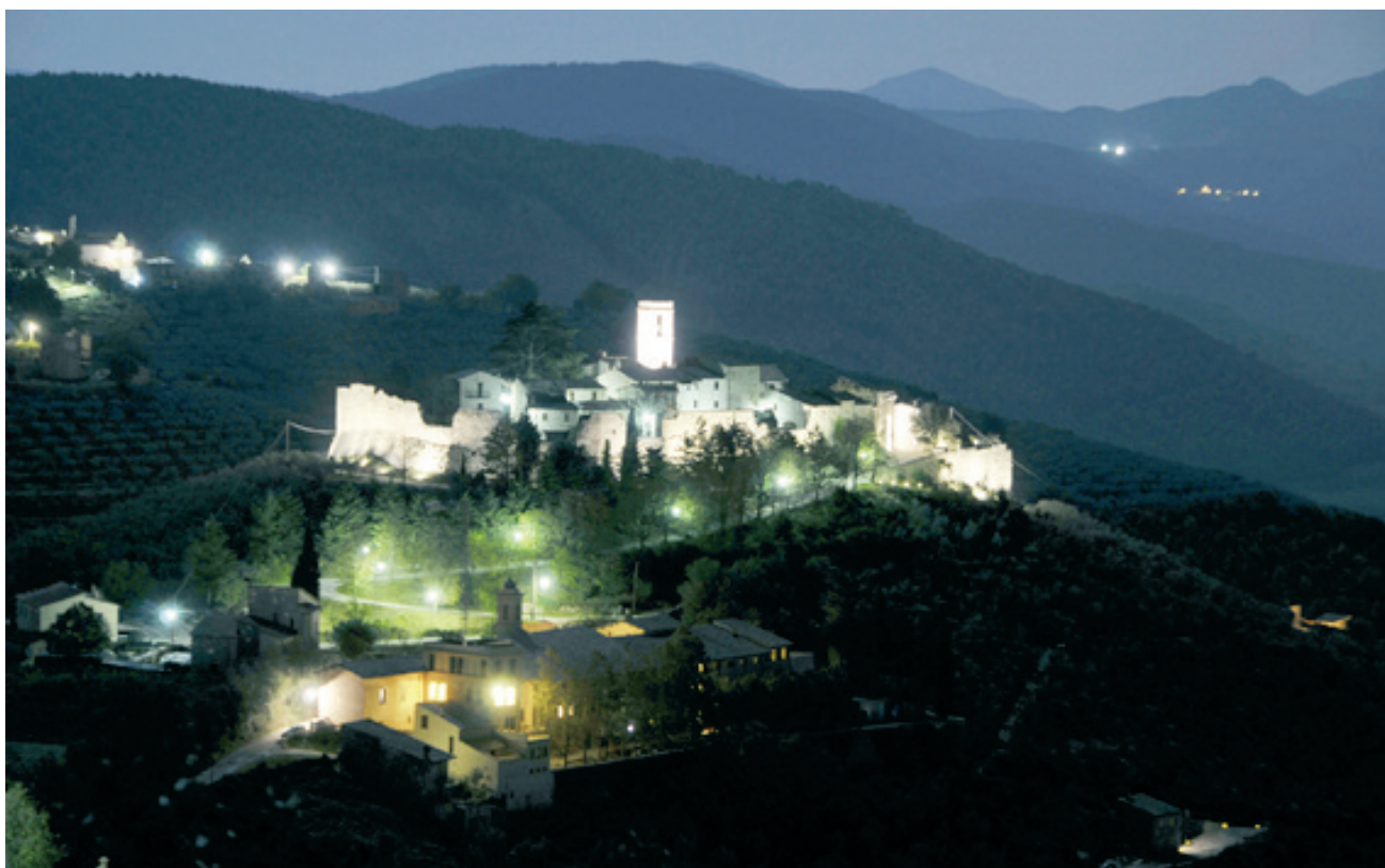
una suggestiva immagine notturna di Campello Alto

gia e suscitano il desiderio di visitare quello straordinario Paese.