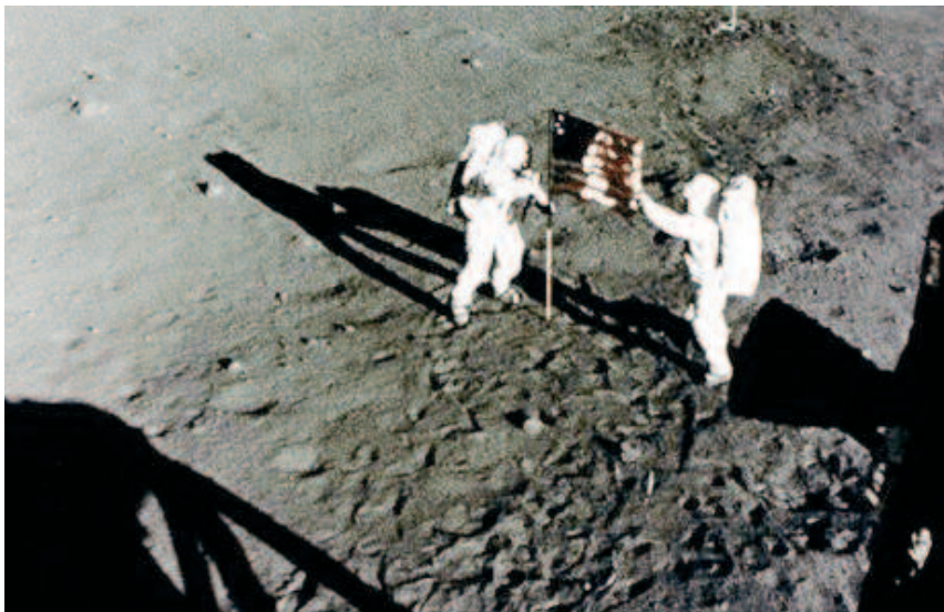
20 luglio 1969 - Armstrong e Aldrin depositano il messaggio ai piedi della bandiera

(‘Adamah): ne ribadisce la condizione creaturale, la finitezza.