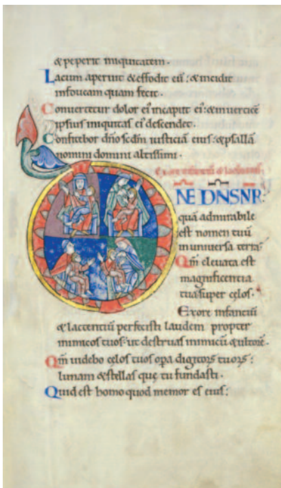
salmo 8, Salterio di St. Alban sec. XII

Con significative variazioni e contrappunti riecheggia almeno sette volte nella Bibbia nell'arco dei secoli, a partire da prospettive e situazioni di grande respiro con tinte tutt'altro che univoche. Ricorderemo qui che la domanda compare la prima volta nel primo Inno di lode del Salterio ( Sl 8,5) e ritorna alla fine, nell'ultimo Salmo regale ( Sl 144,1-4), abbracciando così l'intero Libro delle lodi ( Sefer Tehillim ) di Israele.