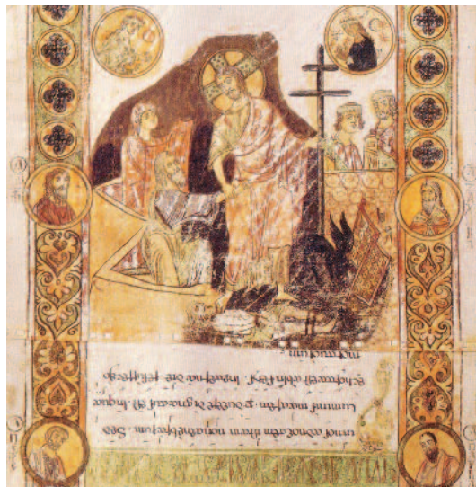
Anastasi - Exultet di Bari, sec. XI

Quel «tutto» sottoposto all'uomo è ben lontano dall'esaurirsi in una lista di sei tipi animali (la lista, come la stessa lode, è per definizione suscettibile di ulteriore sviluppo). A maggior ragione, analogo discorso vale per l'agire di Dio, che fa cose belle per 'enosh: ma quante? Per l'esattezza, di nuovo sei (una in meno rispetto al sette – numero classico di pienezza), tradendo quindi un duplice chiaro indizio di incompiutezza. Il salmista lancia un segnale: manca ancora qualco-