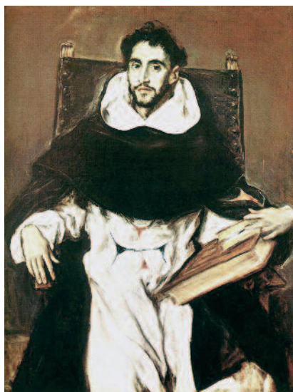
El Greco - Fray Félix Hortensio Paravicino