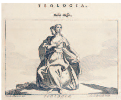
C. Ripa - iconologia della Teologia

zione delle Università cattoliche: «La teologia svolge un ruolo particolarmente importante nella ricerca di una sintesi del sapere, come anche nel dialogo tra fede e ragione. Essa porta, altresì, un contributo a tutte le altre discipline nella loro ricerca di significato, non solo aiutandole ad esaminare in qual modo le rispettive scoperte influiranno sulle persone e sulla società, ma fornendo anche una prospettiva e un orientamento che non sono contenuti nelle loro metodologie. A sua volta, l'interazione con queste altre discipline e le loro scoperte arricchisce la teologia, offrendole una migliore comprensione del mondo di oggi e rendendo la ricerca teologica più aderente alle presenti esigenze» (n° 19).