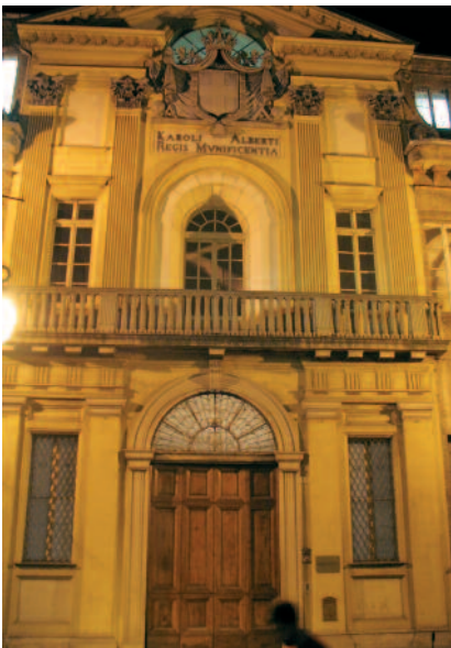
il Real Collegio Carlo Alberto di Moncalieri

nella guerra che continuò la marcia interrotta nel 1866 e rivelò l'Italia grande agli altri e a sé stessa: soldati ed eroi che sono nell'ammirazione nostra e nella venerazione del nostro popolo: Ugo Bassi [1801-1849] e Giovanni Semeria [1867-1931].