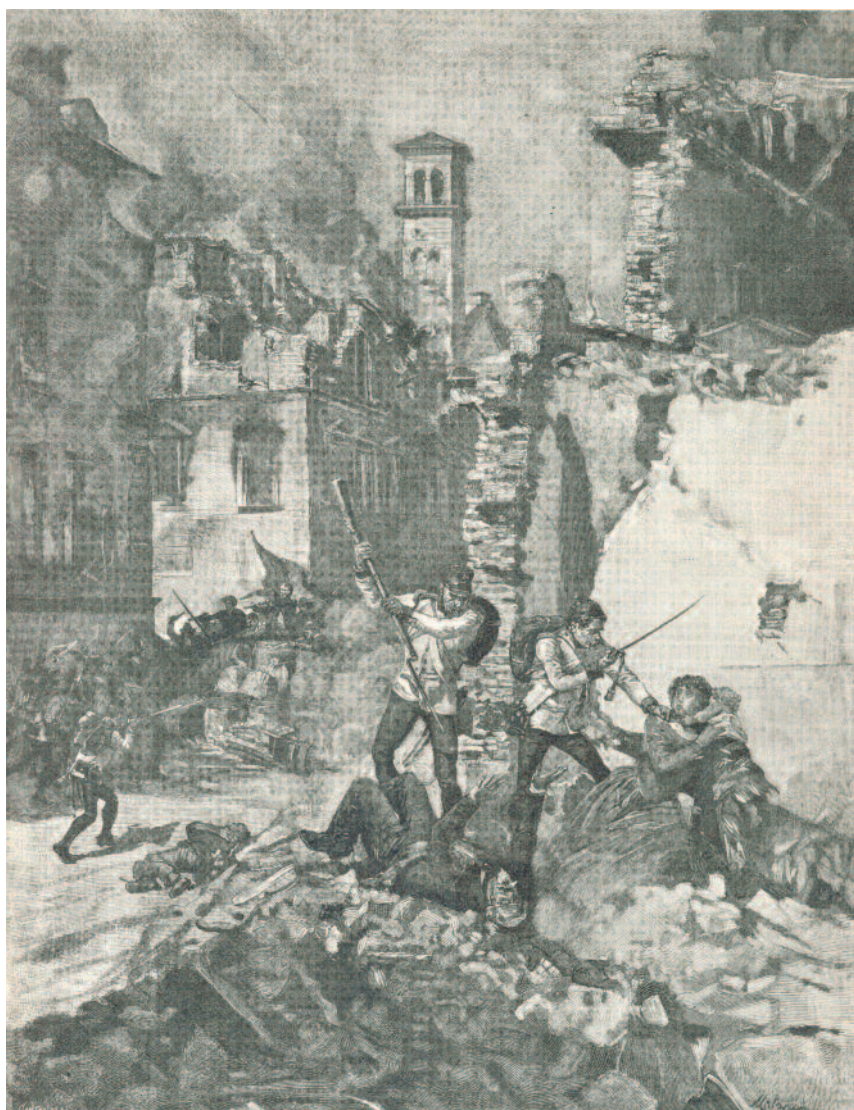
un episodio delle dieci giornate di Brescia: 23 marzo-1° aprile 1849, (illustrazione di E. Matania)

Affermarono e amarono la Patria italiana, e insegnarono ad affermarla e ad amarla ai giovani che accorrevano alle loro scuole: l'amarono fino al sacrificio; potevano, dunque, insegnare ed insegnarono ad amarla, anche se per questo fosse stato necessario morire. Essi la rappresentarono come il centro raggiante, attraverso il quale occorre passare per poter ascendere a respirare, a maggiore altezza, il senso della fratellanza e della solidarietà umana: il centro raggiante, al quale è bello giungere partendo dalla salda e santa