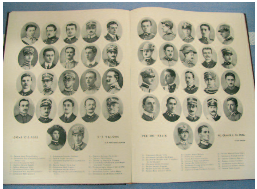
Real Collegio - Pagine d'Italia scritte dagli allievi ed ex allievi dei Barnabiti