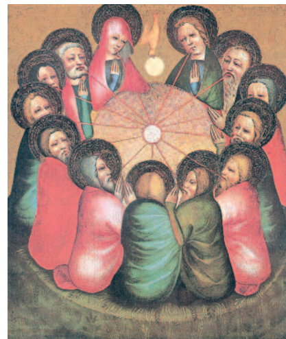
come è bello che i fratelli siano insieme - Pentecoste - Maestro della Westfalia 1380