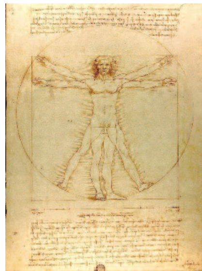
alla ricerca di un nuovo umanesimo

Se questa riflessione può sembrare normale all'interno del pensare cristiano, meno normale, anzi innovativa è intendere lo sviluppo come una vera e propria vocazione della persona. «Nel disegno di Dio, ogni uomo è chiamato a uno sviluppo, perché ogni vita è vocazione. È proprio questo fatto a legittimare l'intervento della Chiesa nelle problematiche dello sviluppo. Se esso riguardasse solo aspetti tecnici della vita dell'uomo, e non il senso del suo camminare nella storia assieme agli altri suoi fratelli né l'individuazione della meta di tale cammino, la Chiesa non avrebbe titolo per parlarne». Ancora, sottolinea e insegna Benedetto XVI evidenziando l'insegnamento di Paolo VI: «Dire che lo sviluppo è vocazione equivale a riconoscere, da una parte, che esso nasce da un appello trascendente e, dall'altra, che è incapace di darsi da