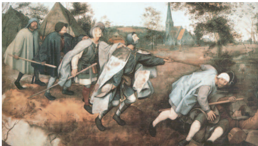
p. Bruegel il Vecchio, la parabola dei ciechi, efficace metafora dell'attuale condizione umana

All'interno di questa consapevolezza diventa rilevante riprendere e rileggere l'enciclica di Paolo VI Populorum progressio scritta a ridosso del Concilio Vaticano II, quasi una naturale continuazione di quel documento originale e per certi versi nella storia della Chiesa, la Gaudium et