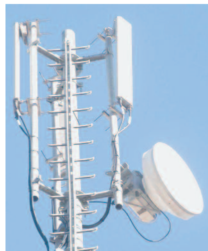
abituale presenza nei cieli delle nostre città

In campo televisivo, forse anche per i maggiori costi che il piccolo schermo comporta, la presenza della Chiesa è meno capillare. Solo nel 1983 fu fondato il Centro Televisivo Vaticano ; e ancor oggi non si tratta