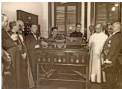
il 12 febbraio 1931 nasceva l'emittente radiofonica del più piccolo Stato del mondo

di una vera e propria trasmittente, ma solo di un centro di produzione e di distribuzione, che garantisce le dirette papali ai diversi canali, cattolici e non, in giro per il mondo. A livello locale si sono diffuse non poche TV cattoliche, ma la loro copertura non può in alcun modo competere con quella delle reti pubbliche e private. In Italia la Conferenza episcopale si è fatta promotrice di un canale, dapprima solo satellitare e ora presente anche sul digitale terrestre: TV2000 (già Sat2000 ), che però stenta a decollare. Mentre ha avuto un discreto successo a livello globale la rete americana EWTN ( Eternal Word Television Network ), la grande intuizione di Madre Angelica che, nata come televisione via cavo, può essere ora ricevuta in ogni parte del mondo attraverso il satellite (l'inizio delle trasmissioni risale al 15 agosto 1981: 30 anni fa!). Manca ancora però alla Chiesa cattolica un canale TV internazionale, che possa competere con i grandi network, quali la BBC o Al Jazeera .