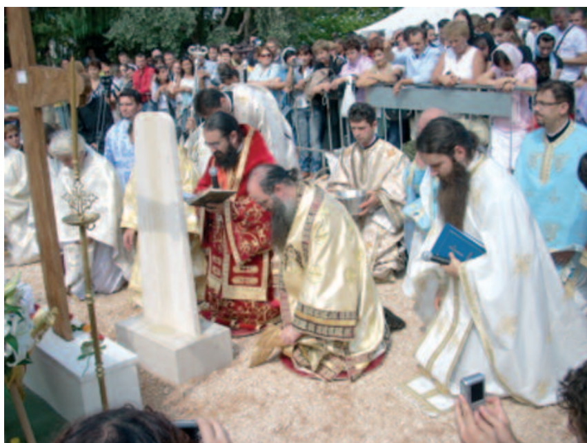
Bari - 10 gennaio 2008. Prima pietra della chiesa dedicata alla ss. Trinità e a s. Nicola

lo in seguito può essere constatata. Questo ci aiuta a comprendere che «fare proprio l'insegnamento ricevuto non è solo ascoltarlo, ma viverlo, integrarlo nella carne e nel sangue della vita della Chiesa. La recezione è ben più della semplice obbedienza, dell'ignoranza o del rifiuto: essa contribuisce a dare senso a una decisione, a volte ben al di là dell'intenzione di coloro che l'hanno presa. La sua totale assenza significa che il testo non ha prodotto alcun frutto nella Chiesa». È l'ora della recezione dei risultati dei dialoghi