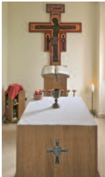
Campello - La "cappellina" del Convento

luoghi di culto, sono cessate le espressioni negative, le ingiurie vicendevoli e le lotte aperte; il riconoscimento dell'unico Battesimo ci ha resi più consapevoli della comu-