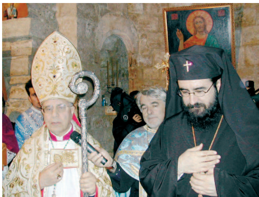
Bari - Un chiaro esempio di recezione - 20 settembre 2009 consegna della chiesa di s. Martino in Trani alla comunità ortodossa romena tranese da parte dell'arciv. Giovanni Battista Pichierrì alla presenza del Metropolita ortodosso romeno di Parigi, Josif

Si vorrebbe procedere più speditamente, lasciandosi trascinare a volte dalla facile tentazione di un controproducente ecumenismo selvaggio , cioè a livello di base, spesso male identificato con « l'ecumenismo del popolo di Dio ». Il pericolo della superficialità che ignorando le direttive ufficiali insegue modelli astratti, è incombente, col rischio di generare confusioni e nuove divisioni. Torna a proposito l'avvertimento del Risorto che pur apprezzando e beneducendo quanto è stato fatto ed è tuttora in atto ci ricorda: «non spetta a voi conoscere tempi e momenti che il Padre ha riservato al suo potere» (At 1,7), assicurandoci però la forza dello Spirito per perseverare con lui nell'impegno a favore dell'unità esplicitamente voluta: « Padre, io in loro e tu in me, perché siano perfetti nell'unità » (Gv 17, 23). Ora che le acque sono state mosse, vorremmo accelerare i tempi e navigare con maggiore energia, realizzare il progetto divino a modo nostro, ma il Signore avverte che ciò non dipende solo da noi e ricorda una cosa importante: « i miei pensieri non sono i vostri pensieri, le vostre vie non sono le mie vie » (Is 55,8). È consolante però la certezza della sua assistenza che non deluderà le attese: « La mia parola non ritornerà a me senza effetto, senza aver operato ciò che desidero e senza aver compiuto ciò per cui l'ho mandata » (55,11). L'unità c'è già, è vera, ma dovrà essere ri-