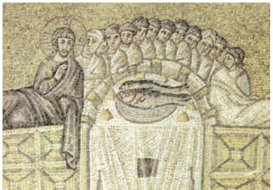
Ravenna - Ultima Cena, Sant'Apollinare Nuovo

Il Figlio di Dio voleva reintegrare l'uomo in una dignità pari alla precedente, anzi maggiore; perciò gli preparava un cibo celeste, il Pane degli Angeli, se stesso, il Suo corpo e il suo Sangue come nutrimento. E siccome da parte nostra sarebbe stato oltraggioso lasciare cadere, nel nostro cuore, il ricordo del suo amore, ce ne ha lasciato una testimonianza in questo Santissimo Sacramento.