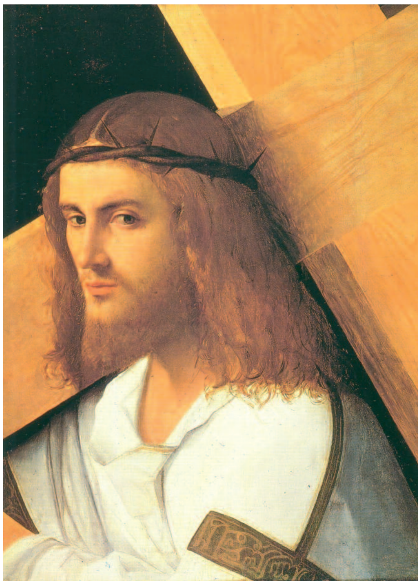
... Camminare sulle orme di Cristo. Giorgione - Cristo porta croce (part.)

Ci dà tre comandi che, se praticati, ci porranno nella giusta prospettiva di fronte a noi stessi, il prossimo e Dio. Esaminiamoci e giudichiamoci da noi stessi, per non essere giudicati da Dio. Innanzitutto Egli vuole che praticiamo giudizio e giustizia. La capacità di giudicare