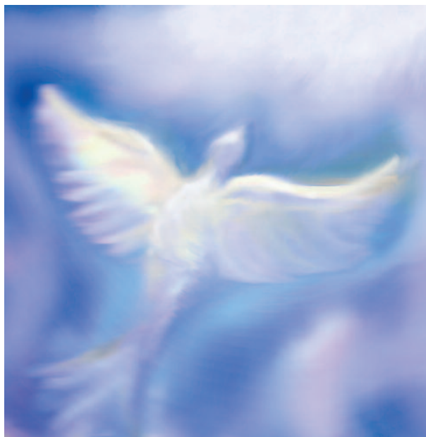
ammaestrati ed educati dallo Spirito

A queste due segue la terza cosa che il Signore ci richiede: camminare sollecitamente con Dio, allo stesso modo che un buon figlio rispetta in tutto il padre: lo teme, lo ama, lo riverisce, lo onora. Bisogna dunque che noi abbiamo lo stesso atteggiamento nei confronti di Dio. Se ci comporteremo così, quali buone conseguenze ne deriveranno: riconosceremo e rispetteremo come rappresentanti di Dio, i Sacerdoti; ammireremo la