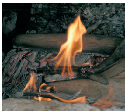
fuoco, energia cosmica

Si è parlato dell'esistenza umana come di una trasparenza, una diafanità della presenza divina, e pur riconoscendo che tale presenza abita in ogni creatura, dobbiamo ammettere che essa raggiunge il suo culmine in quegli esseri che sono stati formati a immagine e somiglianza di Dio. Sappiamo poi che tale presenza è avvertita in modo diverso a seconda che ci si muova in un'ottica immanentistica (il «divino» che permea ogni realtà quasi a confondersi con essa) o in un'ottica trascendente, quale è quella propria della rivelazione biblica, che percepisce il divino come «altro» che entra in dialogo d'amore con l'umano. Su questa duplice modalità aveva riflettuto Pierre Teilhard de Chardin, il gesuita paleontologo e mistico, distinguendo due vie di fatto percorse nella storia umana. La via orientale finalizzata all'identificazione con il fondo comune del Reale, con un Tutto per lo più impersonale. La via occidentale per la quale la comunione con il Tutto esalta gli elemen-