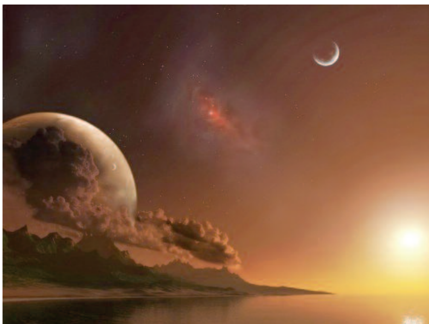
lo spettacolo della natura

superconcentrazione . In altri termini il primo passo consiste nel radicarsi nel proprio vero essere e quindi nell'autoappartenersi. Con questo termine intendiamo tutto ciò che ci riconduce a noi stessi, a cominciare dalla conoscenza di sé, dalla pratica della consapevolezza, dalla pratica dell'“ adesso ”, dall'armonizzazione e integrazione dei tre livelli della nostra persona: corpo, cuore (sentimenti, emozioni, affetti), spirito (intelligenza e libera volontà). A questo proposito svolge un ruolo decisivo lo meditazione .