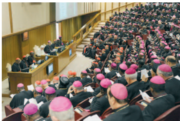
preparando il Sinodo del 2012

più parlato. Ed effettivamente i primi anni del pontificato di Benedetto XVI potevano dare questa impressione; ma si è trattato, appunto, di una impressione passeggera. A giudicare dagli ultimi interventi di Papa Ratzinger, sembrerebbe di capire che anche per lui la "nuova evangelizzazione" continui a costituire una priorità della Chiesa attuale. Il 21 settembre 2010, infatti, con il motu proprio Ubicumque et semper , il Papa ha istituito il "Pontificio Consiglio per la promozione della nuova evangelizzazione". Successivamente ha deciso che il tema della prossima assemblea generale ordinaria del Sinodo dei Vescovi, che si terrà dal 7 al 28 ottobre del 2012, sia "La nuova evangelizzazione per la trasmissione della fede cristiana". Il 2 febbraio scorso la Segreteria generale del Sinodo ha pubblicato i Lineamenta , che serviranno per la preparazione dell'assemblea. Come si vede, non si trattava dell'idea fissa di un Papa, ma di una vera e propria esigenza della Chiesa odierna. "Nuova evangelizzazione" non è uno slogan, ma una "parola d'ordine": « Dal Concilio Vaticano II in poi i Papi ci hanno offerto una chiara parola d'ordine per una pastorale presente e futura: "nuova evangelizzazione", cioè nuova proclamazione del messaggio di Gesù, che infonde gioia e ci libera » ( Lineamenta , n. 24).