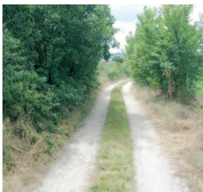
percorrere nuove strade per l'evangelizzazione

teorie di tipo relativistico che intendono giustificare il pluralismo religioso non solo de facto , ma anche de iure (« Si afferma addirittura che la pretesa di aver ricevuto in dono la pienezza della Rivelazione di Dio nasconde un atteggiamento d'intolleranza ed un pericolo per la pace »).