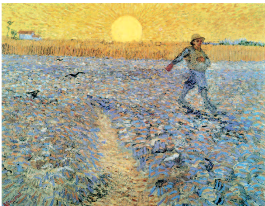
Vincent Van Gogh - il Seminatore

atteggiamento di fedele conservazione. Certo, il tesoro di verità e di grazia, a noi venuto in eredità dalla tradizione cristiana, dovremo custodirlo, anzi dovremo difenderlo [...]. Ma né la custodia, né la difesa esauriscono il dovere della Chiesa rispetto ai doni che essa possiede. Il dovere congeniale al patrimonio ricevuto da Cristo è la diffusione, è l'offerta, è l'annuncio» ( Ecclesiam suam , III). Non potrebbe essere espresso in maniera più chiara il cambiamento di mentalità intervenuto nella Chiesa cinquant'anni fa.