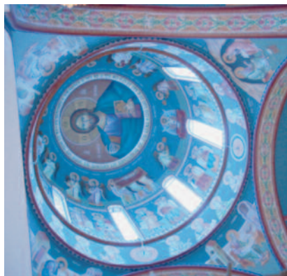
Lepanto (Grecia) - la cupola della chiesa nuova del monastero della Trasfigurazione affrescata di recente dai monaci

È interessante notare la sottolineatura riservata al giusto valore della materia contro chi disprezzava l'uso del legno, delle terre e dei colori per realizzare le sacre icone: «La materia è creazione di Dio, essa è buona: io onoro, tratto con rispetto e venero la materia attraverso la quale è avvenuta la mia salvezza e la onoro non come dio, ma come piena di potenza e di grazia divina. O forse non è materia il legno della croce?... Non accusare la materia! Tra le cose che provengono