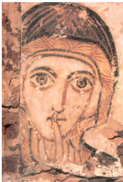
Faras (Egitto) - affresco, sec. VIII

La liturgia bizantina in particolare traduce visibilmente questa realtà nell'orientamento e nella disposizione architettonica e iconografica delle chiese, col santuario, l'altare, il velo, la navata, l'ambone, il battistero, le icone. Tutto ha un senso preciso. Voce, canto, preghiera, corpo, vesti, gesti, profumo, sensi, tutto è chiamato a partecipare, tutto è coinvolto e converge nella raffigurazione e nel simbolismo cosmico. Le icone in particolare richiamano e raffigurano la liturgia celeste e aiutano il fedele a percepire la reale presenza luminosa di Dio: sono il riflesso del mistero di Dio. Ma la luce di Dio è percepibile nei riti e nelle icone attraverso il riflesso misterioso del volto di Cristo, luce radiosa dell'eterna gloria del Padre . La stessa liturgia bizantina è come una grande icona che invita il fedele a lasciarsi immergere nella luce di Cristo e a lasciarsi toccare dalla grazia divina. Collocata in tale contesto, destinata al servizio della gloria di Dio, si comprende allora come l'arte sacra, iconografica in particolare, non possa esistere senza canoni o norme, ma debba rispondere