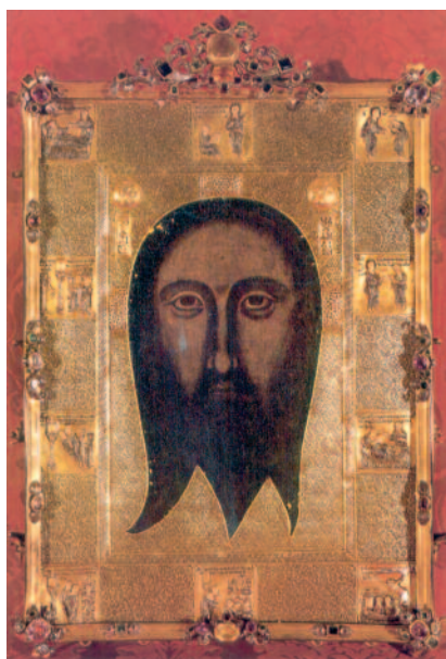
Genova, S. Bartolomeo degli Armeni - Mandylion

Se poi si vogliono delineare i termini teologici del conflitto antecedente e conseguente al concilio Niceno II (787) che aveva definito e approvato la venerazione delle icone, l'insieme della documentazione mostra con chiarezza che la lotta contro o a favore dell'icona non è stata motivata da una semplice questione di estetica religiosa. Essa ha avuto implicazioni teologiche ben più vaste e profonde, come la trascendenza stessa di Dio, la