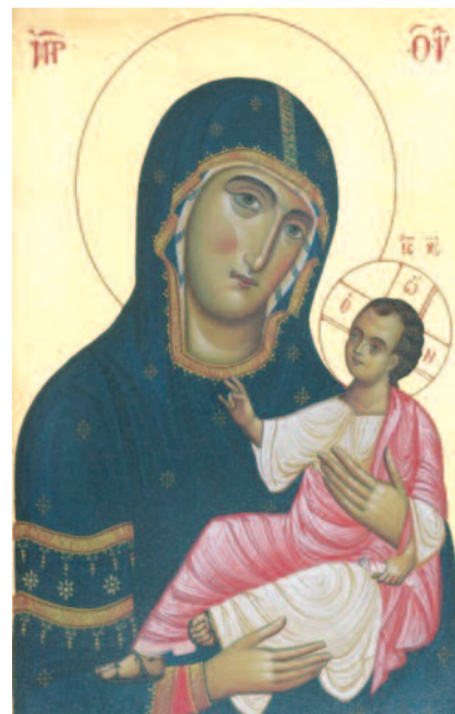
Lepanto (Grecia) - S. Maria della fonte, opera di un monaco del laboratorio iconografico del monastero della Trasfigurazione

Quanto all'approccio estetico e storico-artistico è certo interessante comprendere come nel cristianesimo siano state realizzate le prime manifestazioni artistiche di tipo figurativo e come siano stati elaborati i modelli portanti e gli schemi caratteristici dell'iconografia cristiana antica e bizantina che ci permettono di conoscere il pensiero religioso sotteso, evidenziando comunque il rapporto che esiste tra iconografia e storia dell'arte, pure nella difficoltà di stabilire dove termina il compito dell'iconografo e inizia quello dello storico dell'arte, e viceversa. Mentre per l'iconografo l'elemento formale non ha un interesse diretto, ma preferisce richiamare all'importanza fondamentale del rapporto con la teologia, per lo storico dell'arte è di somma importanza la qualità stilistica e tecnica dell'opera.