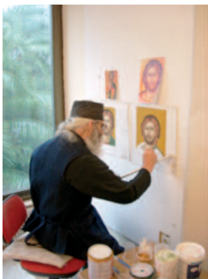
Lepanto (Grecia) - un monaco iconografo del monastero della Trasfigurazione al lavoro

a un mandato specifico in obbedienza alle regole proposte dalla tradizione della Chiesa, che non mortificano affatto la genialità dell'artista. L'iconografo con le sue icone esercita nella Chiesa una speciale diaconia perché educa l'uomo a vivere sempre alla presenza dell'Invisibile attraverso il visibile, non solo, ma aiuta il cuore dell'uomo che le contempla collocate con cura nell'angolo bello delle case e nelle chiese, tra lampade e fiori, in particolare davanti all'iconostasi, ad avvertire e percepire misteriosamente, tra i richiami di tanta bellezza, la presenza della grazia divina e la sua virtù che santifica la vita. La liturgia soprattutto fa incontrare Dio che si è fatto vicino all'uomo in Gesù Cristo. I santi Basilio (+379) e Gregorio Palamas (+1359) amavano evidenziare in proposito che appunto perché «le energie di Dio scendono a noi» ed è «possibile partecipare della divina energia», grazie allo Spirito di Cristo, la nostra vita può essere divinizzata o deificata: in questo sta la vocazione dell'uomo.