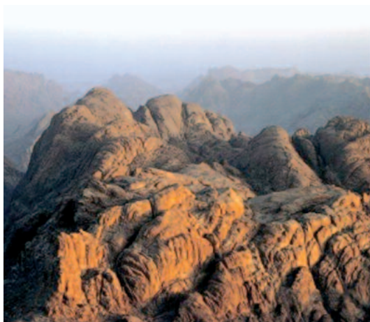
il Sinai - simbolo dell'incontro con Dio

«Tieniti pronto per domani mattina» : il Signore Dio vuole che l'anima religiosa sia sempre preparata e pronta alla sua divina volontà, non nelle tenebre e nell'oscurità, ma nella chiarezza e nella luce