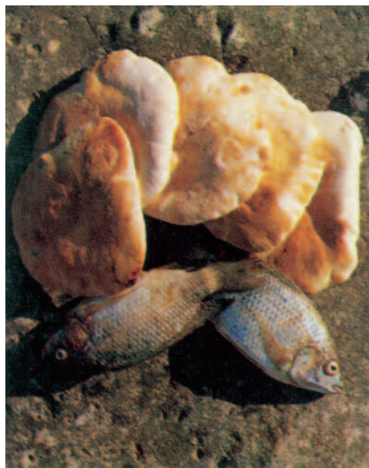
il pane della vita: l'Eucarestia

ligiosa, qui la norma, qui il libro che ci insegna la vera astrazione, il vero spogliamento da tutti gli affetti sensuali, da tutti gli attaccamenti, comodità e dilette; né si parla solo del corpo, ma anche dello spirito: dobbiamo essere spogliati in tutto di questi interessi, di queste sensualità, anche spirituali. Lo vediamo, per esempio, in quelle parole che il Signore Dio disse ai suoi Apostoli: «Se non me ne vado, non verrà a voi il Consolatore» (Gv 16,7). Forse che la presenza del Signore impediva la venuta dello Spirito Santo? No; sarebbe come dire una bestemmia; Dio non voglia; ma impediva la sensualità con la quale gli erano appoggiati. Non era perfetto l'amore degli Apostoli verso il loro