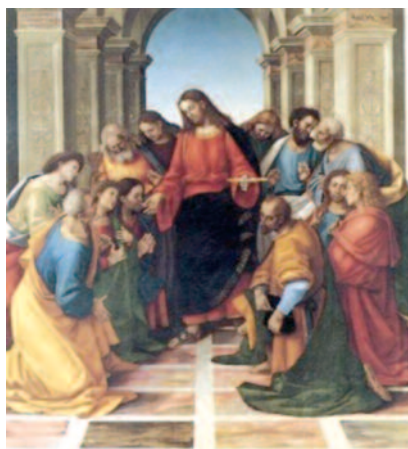
Luca Signorelli - la comunione degli Apostoli

grazia, non solo del suo aiuto (cose pur tanto stimate da questo mondo nelle persone grandi), ma ci fa padroni del suo proprio corpo, sangue e anima: insomma di tutto se stesso. O dilette, che eccesso d'amo-