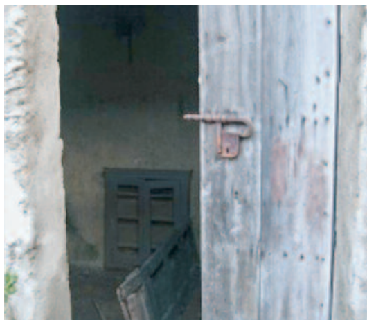
aprire la porta a Cristo

Dilettissime figliole, qui abbiamo gli esempi, qui le regole della vita re-