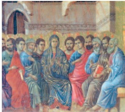
Duccio di Boninsegna - la discesa dello Spirito Santo

Abbiamo celebrato la missione dello Spirito Santo [la Pentecoste], ricordato quei molteplici favori che ci ha fatto Dio di spargere in tanta abbondanza la sua grazia sopra noi indegne e ingrato creature sue, in modo tale che la ricevessero e la godessero non solo in quel tempo, o quei soli che allora furono presenti, ma ne partecipassimo e sentissimo anche tutti noi, dovendo essa fruttificare sino alla fine del mondo. Quelle, dico, sono state feste solenni di grazie segnalate e singolarissime; ma questa che segue [il Corpus Domini], le trascende e supera tutte. In quella il Signore Dio ci dona la grazia e il suo aiuto, ma in questa ci favorisce non solo della